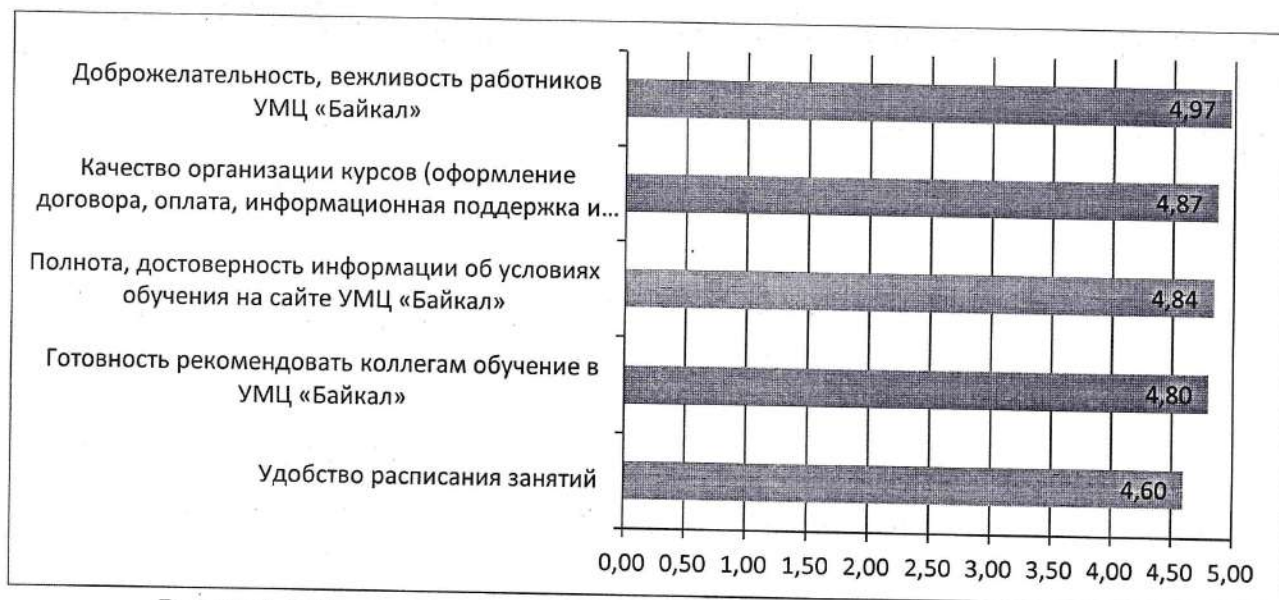
Рисунок 4. Результаты оценки условий предоставления услуги

Индекс удовлетворенности слушателей по перечисленным критериям оценки составил 4,62, 4,88 и 4,82 баллов из 5 (оценка содержания программы, компетентности преподавательского состава и условий предоставления услуги соответственно).