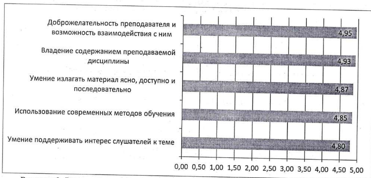
Рисунок 3. Результаты оценки компетентности преподавательского состава

Результаты оценки удовлетворенности компетентности преподавательского состава показаны на рисунке 3.